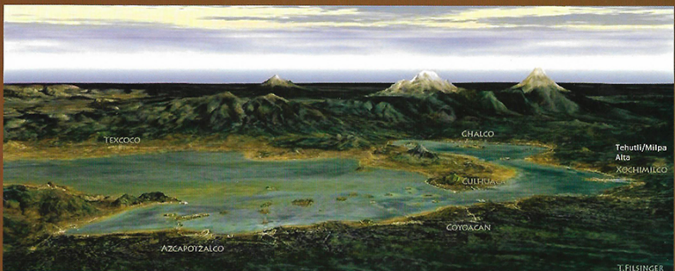
La Ciudad de México en el México antiguo

Si deseas hacer uso de la información de este calendario (textos e imágenes) agradeceremos citar la fuente y créditos correspondientes. Si tienes alguna duda contactanos. maspornosotros@gmail.com