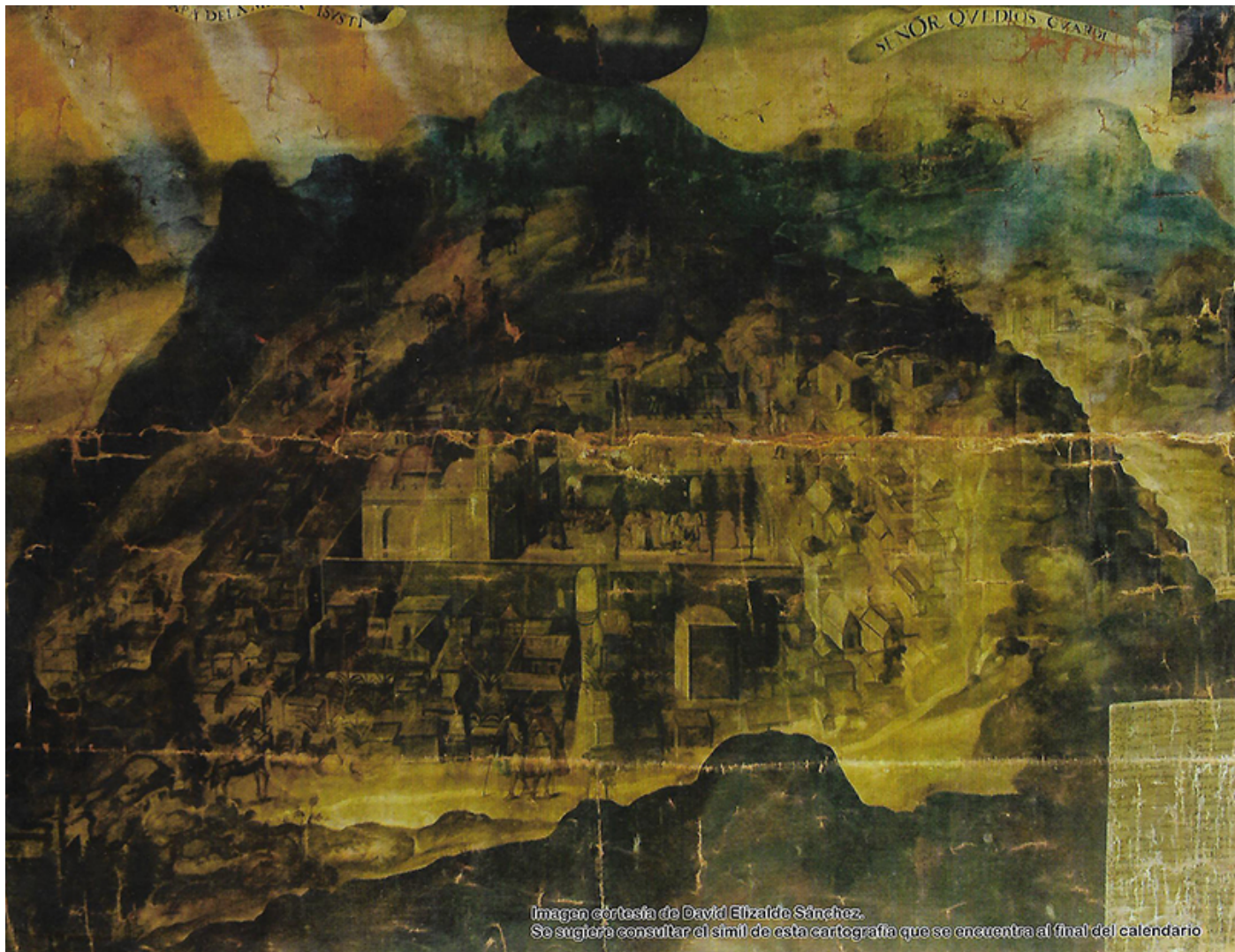
Imagen cortesía de David Elizalde Sánchez. Se sugiere consultar el similitud de esta cartografía que se encuentra al final del calendario