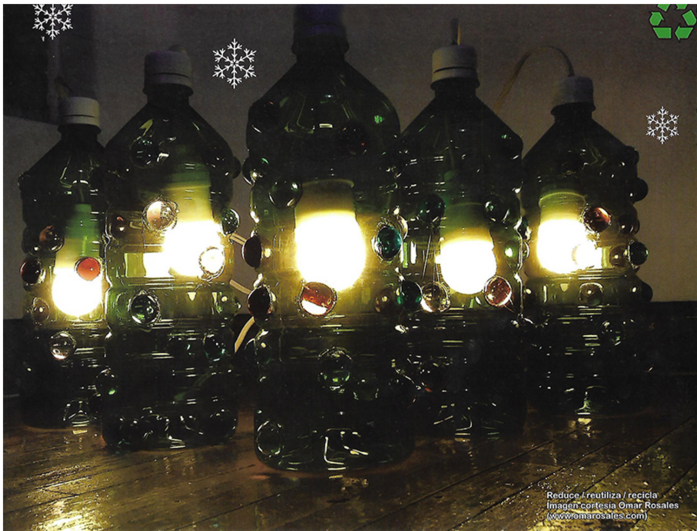
Reduce / reutiliza / recicla