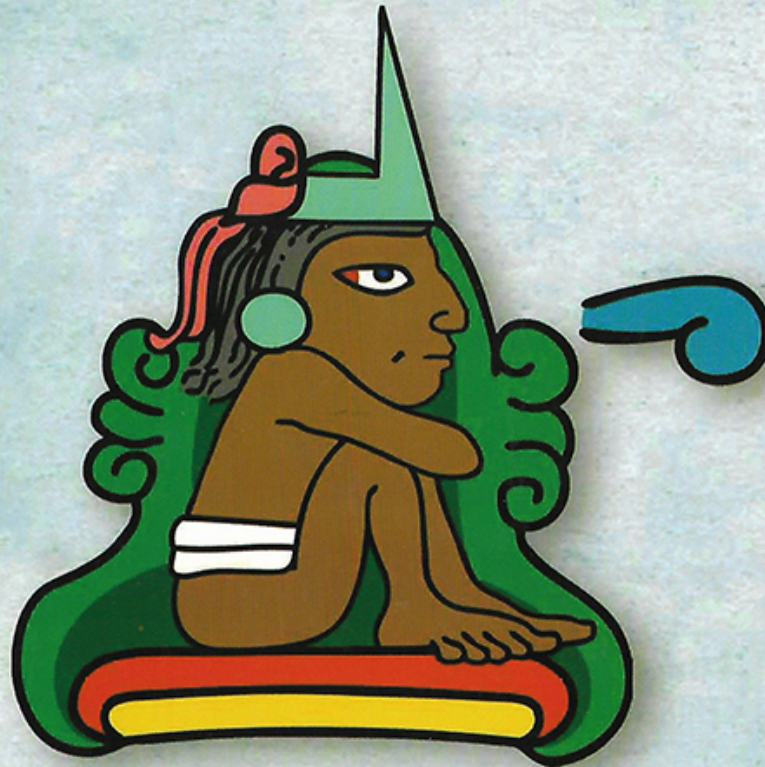
Topónimo del volcán Tehulli en Malacachtepec Momoxco Milpa Alta Fernando Palma 2014