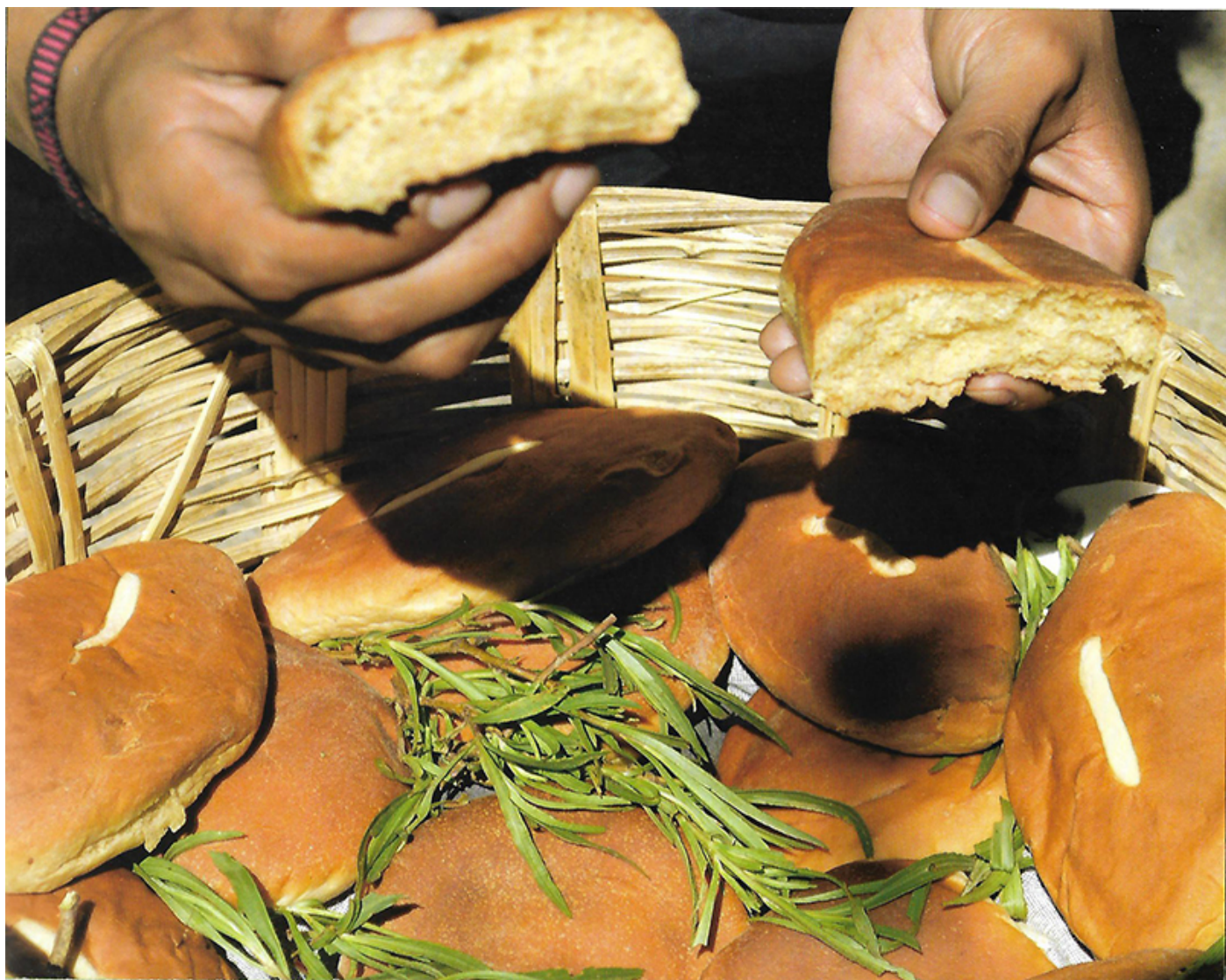
Los cocoles de Milpa Alta