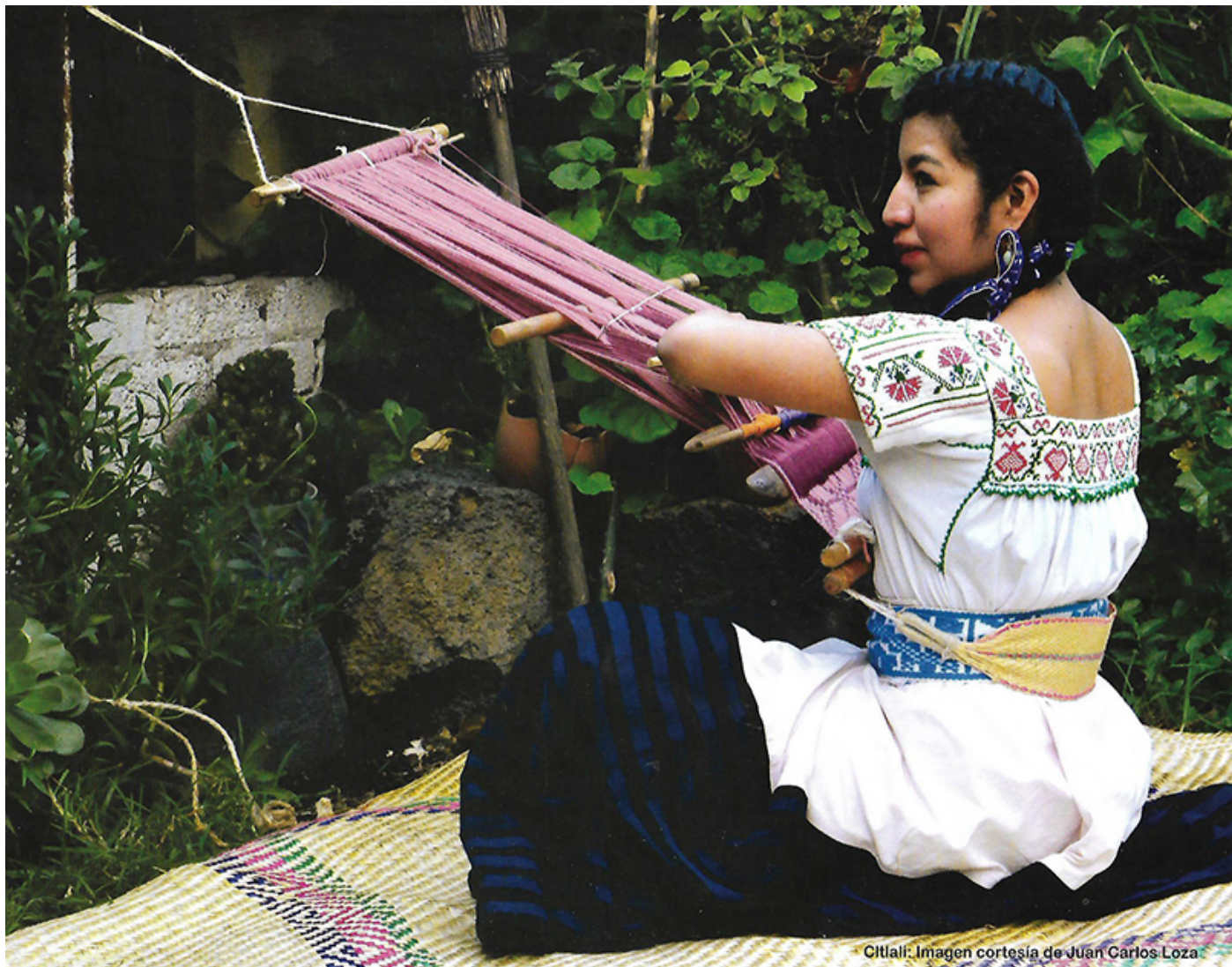
Cittali: Imagen cortesía de Juan Carlos Loza